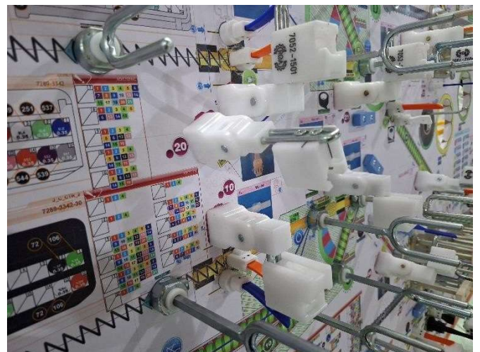
4 - Elementos mistos