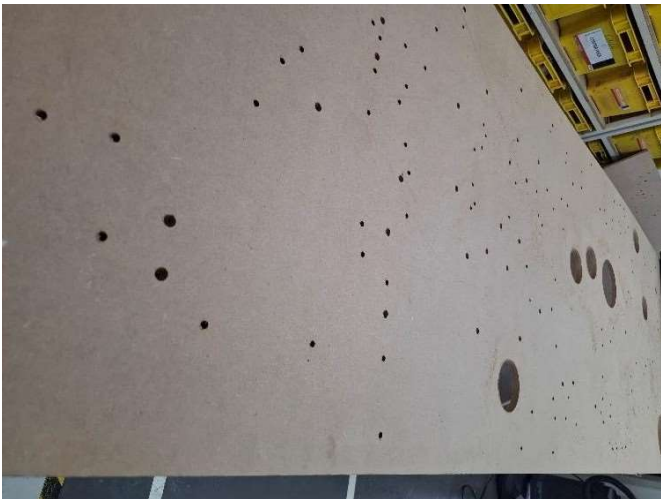
1 - Chapa em MDF