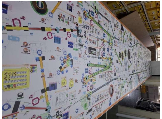
2 - Lona de impressão