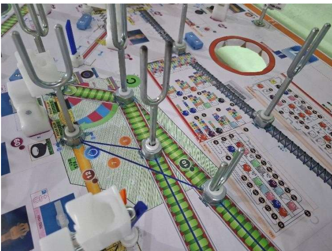
3 - Elementos metálicos