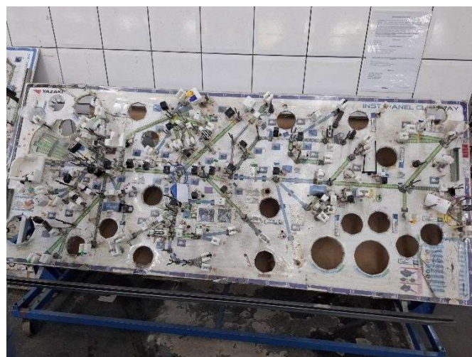
6 - Painel finalizado